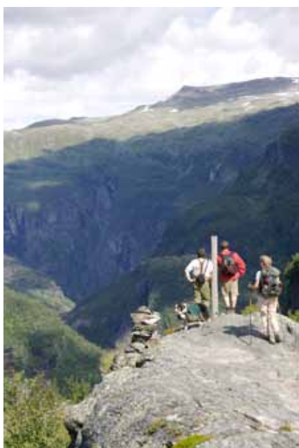
På vej ned gennem Aurlandsdalen. På Sinjastølen produceres den traditionelle norske brunost.

Dagen byder på en forholdsvis lang og derfor krævende tur ned gennem Aurlandsdalen. Det er en vandreklassiker der har fået tilnavnet "Elskovsturen". Stien fører forbi dramatiske, stejle og fantastiske partier. Forhåbentlig er Sinjastølen bemanded