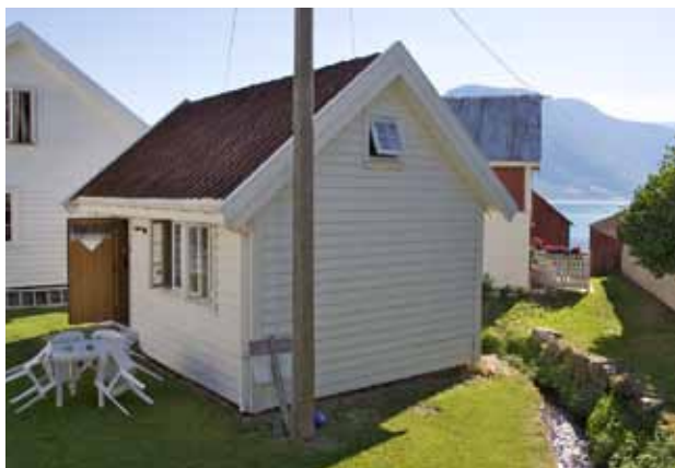
Et af "vores" huse i Solvorn. Stavkirken i Urnes er i en klasse for sig.