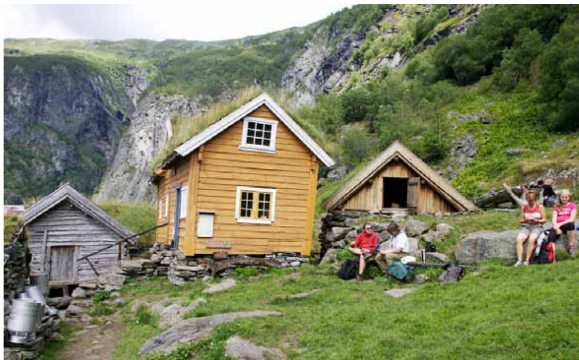
Et velfortjent hvil på Sinjastølen undervejs på turen gennem Aurlandsdalen.

Herefter forflytter vi os til højfjeldet for bl.a. at vandre klassikerturen gennem "Elskovsdalen". En tiltrængt dasedag i det romantiske Solvorn, lige i fjordkanten. Næste stop er 2 nætter på en historisk gård, hvorfra der arrangeres to prægtige vandreture. Vandreturene rundes af med en tur på Nigardsbræen. Under kyndig instruktion og guidning vandrer vi et par timer op på isen – på mange måder en af turens højdepunkter. Til slut tager vi båden tilbage til Bergen – en flot 6-timers sejltur gennem Sognefjorden og Vestlandets skærgård.