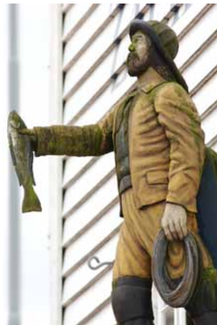
Bryggen i Bergen og køreturen med Fløibanen er byens store attraktioner.